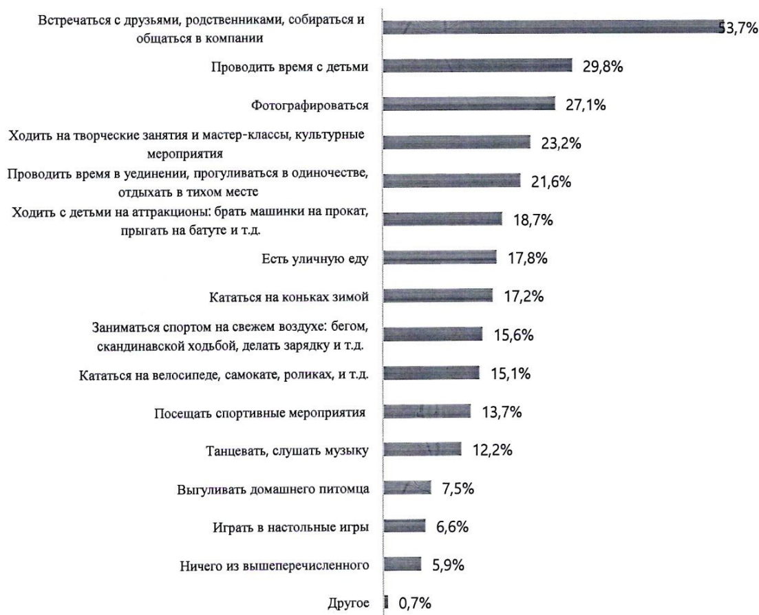
Рис.1. Предпочитаемые виды досуга на территории Центра детского творчества «Кристалл» после благоустройства

По итогам проведённых мероприятий, ключевым сценарием использования территории Центра детского творчества «Кристалл» после благоустройства должны стать общение и совместный досуг: более половины респондентов (53,7%) хотели бы встречаться на территории с друзьями и родственниками. Выражен запрос на семейно-ориентированное пространство – почти треть жителей (29,8%) планирует проводить время с детьми, в том числе с использованием аттракционов (18,7%). Значимым аспектом является визуальная привлекательность территории: более четверти опрошенных (27,1%) рассматривают её как место для фотографирования. Дополнительно фиксируется интерес к культурно-досуговым форматам (23,2%), предполагающим проведение мероприятий и мастер-классов, а также к спокойному отдыху и уединению (21,6%). Это указывает на необходимость формирования универсальной среды, включающей как активные зоны для событийной активности, так и тихие, изолированные пространства для отдыха.